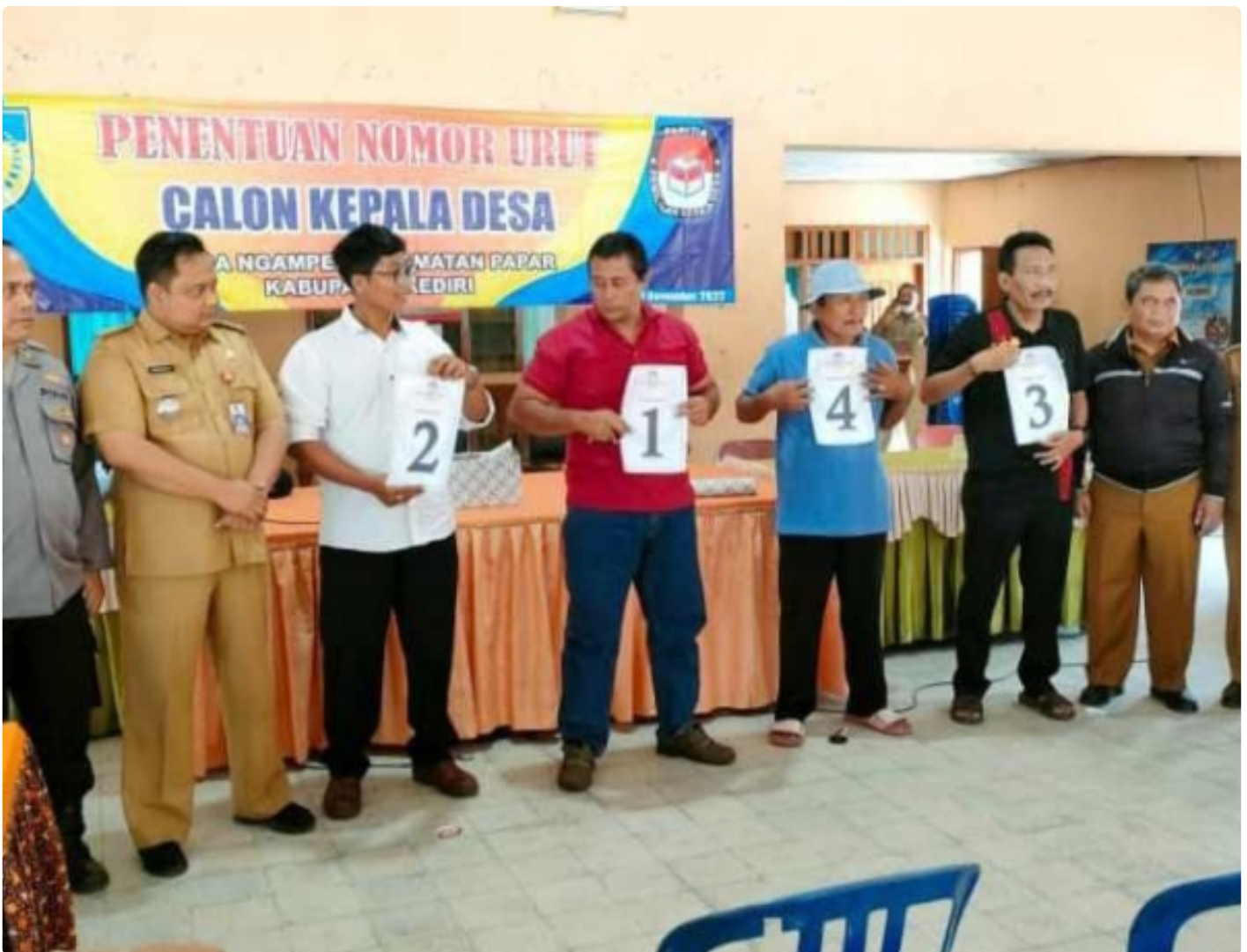
KEDIRI - Kegiatan penentuan nomor urut Calon Kepala Desa Ngampel